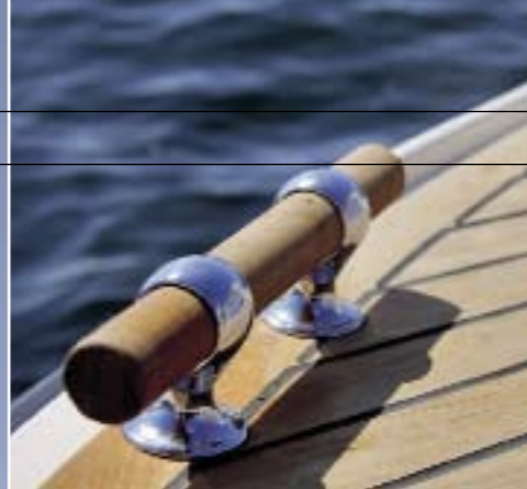
TEAKDÄCK INGÅR i standardutrustningen. Nannidieseln på 14 hästar ger en marschfart på fem knop.