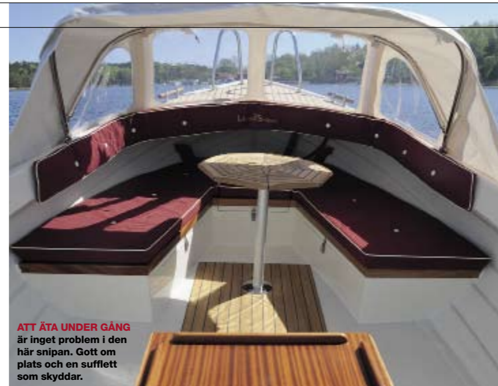
ATT ÄTA UNDER GÅNG är inget problem i den här snipan. Gott om plats och en sufflett som skyddar.

En viktig detalj på en badbåt är en bra badstege. Långsjösnipans sitter på styrbordssidan och är fällbar, vilket betyder