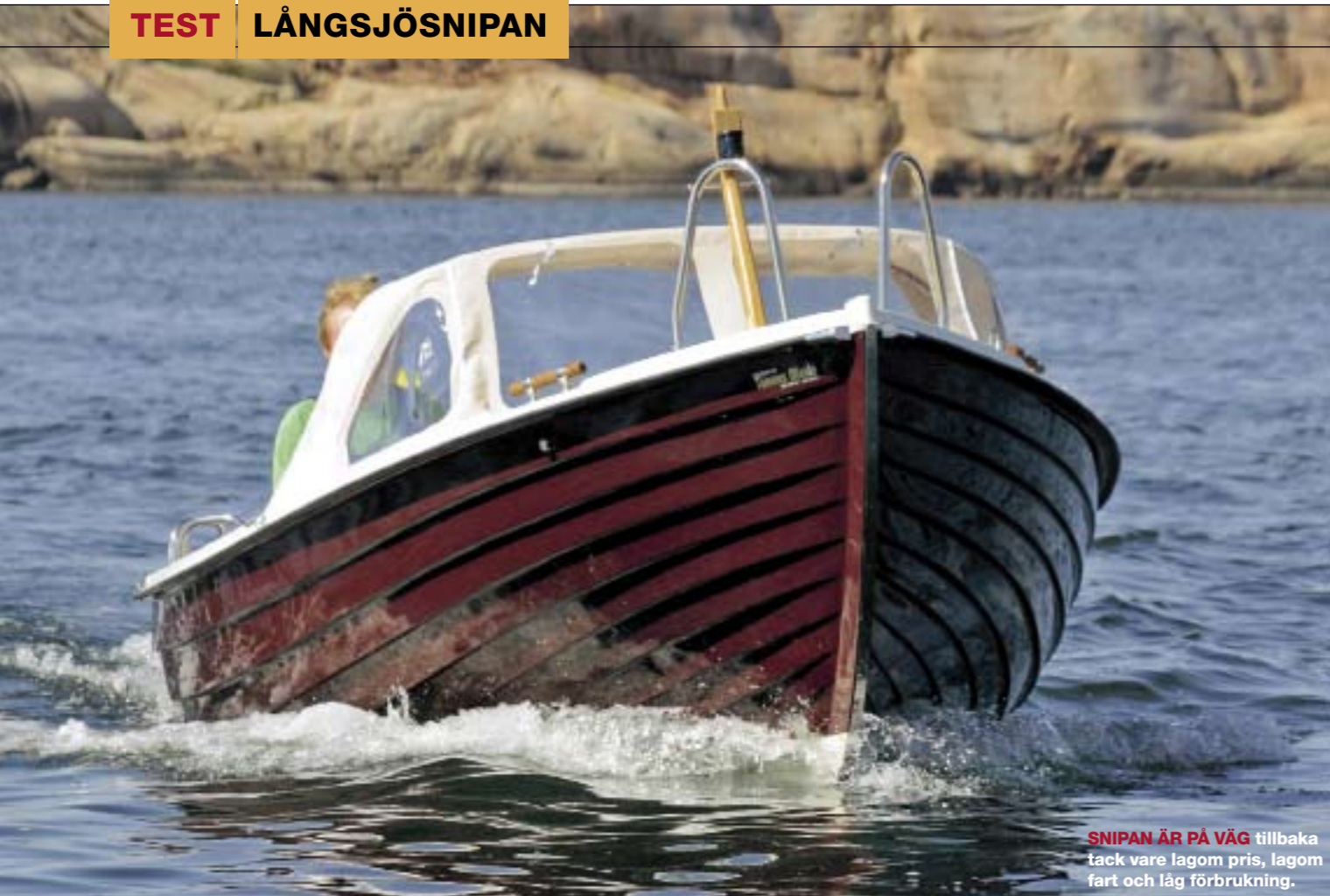
SNIPAN ÄR PÅ VÄG tillbaka tack vare lagom pris, lagom fart och låg förbrukning.

D en lilla snipan borde vara familjens badbåtsval nummer ett. Fördelarna är många. I sex knop är det lätt att hålla koll på småtingarna, dricka förmiddagskaffe och navigera. Samtidigt. Och skulle du ändå gå på grund är skadan ringa – drev finns ju inte.